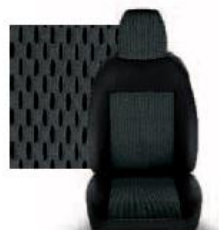
STAR GRIGIO 213