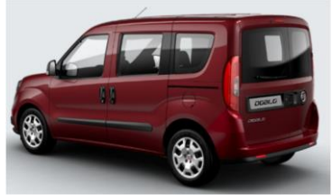
Забарвлення кузова фарбою металік (код 612)