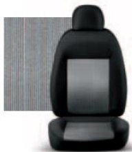
PIN STRIPE GRIGIO 223