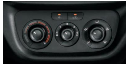
Кондиціонер з ручним регулюванням