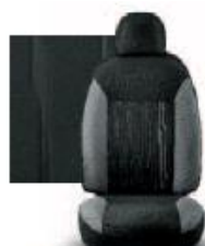
POP OLONA GRIGIO 301