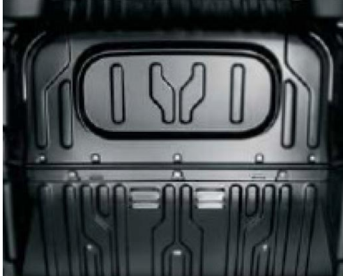
Глуха перегородка для версії з 3-х містим салоном