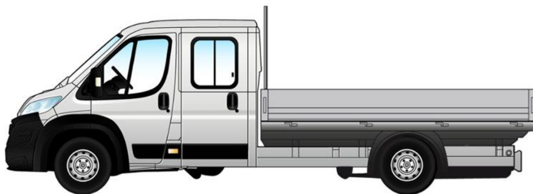
Габаритні розміри та розміри вантажного відділення, мм

Забарвлення кузова пастельною фарбою білого кольору (код 549 – DUCATO BIANCO)